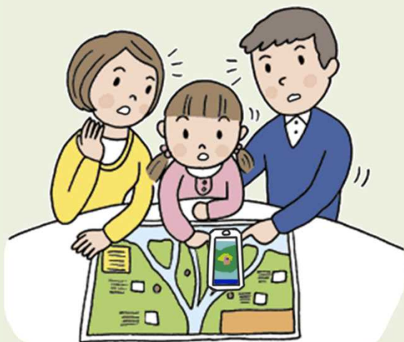
気象や警報に関する情報の収集

雨が降り出したら、雨雲の動きや雨量情報、土砂災害警戒情報に注意しましょう。豪雨になる前に、早めの避難を心がけることが大切です。