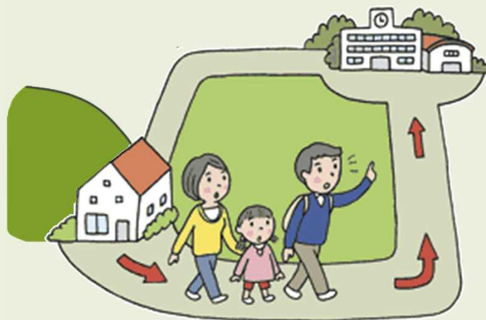
危険を感じたら早めの避難